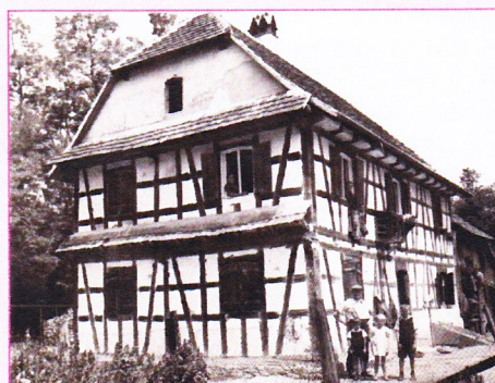
Texte et photo René Deiber

La Ferme « Schneider Michel » a été démolie et la forêt alentours rasée lors de la création du plan d'eau par EDF, mis en eau le 1 er juillet 1970.